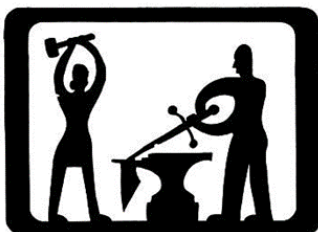
Zwaarden omsmeden tot ploegscharen